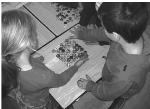
figuur 1: vierkantsgetallen

Rechthoeksgetallen zijn getallen die je als product van twee factoren kunt schrijven. Er zijn getallen, zoals bijvoorbeeld 24, waar je heel veel rechthoeken van kunt maken; er zijn veel verschillende rechthoeken met oppervlakte 24, hoeveel? Van sommige getallen kun je maar één rechthoek maken (of twee als je een rechthoek van 1 bij 7 anders ziet dan een rechthoek van 7 bij 1). Wat zijn dit voor soort getallen? Je zou ze strookgetallen kunnen noemen. Het zijn de priemgetallen.