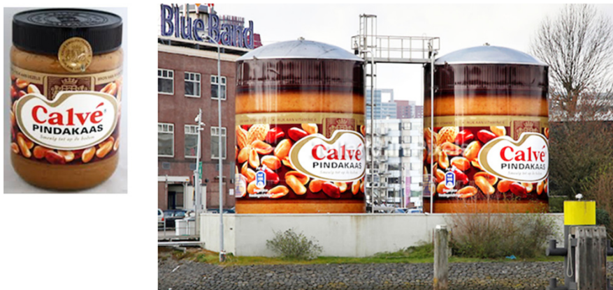
figuur 1: verschillende pindakaaspotten

Van Doornik-Beemer richt de aandacht op verschillende niveaus en gebruikt daarbij de ijsbergmetafoor. Ze wijst de studenten ook op het nadenken over de beginsituatie van de collegastudenten. Ze vertelt hoe zij de les met de studenten evalueert op de punten interactie, samenwerken en ontwerpen. Dit brengt haar tot haar stelling over het stimuleren van wiskundig denken bij deze pabo-studenten.