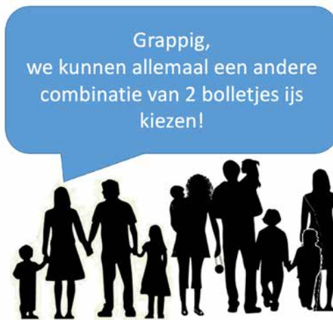
◀ Afbeelding 4. Hoeveel combinaties kun je maken?

kloppen? Dit wordt afgewisseld met een buitenspel (De allergrootste voetstap), de quiz Kan het kloppen? , een spel Het 100-veld vullen aan de hand van dobbelsteenworpen en het afrondende deel Verdiept onderzoek .