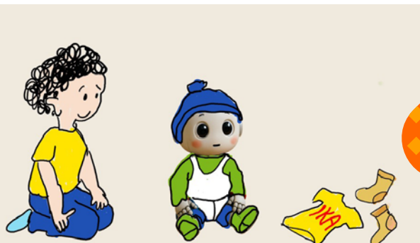
▲ Afbeelding 3: Ika, de robot uit Japan.

De kinderen doen eerst een klassikale activiteit waarin ze nadenken over verschillende volgordes om Ika, de robot uit Japan, kledingstukken aan te trekken (afbeelding 3). Daarna volgt een circuit met activiteiten die steeds