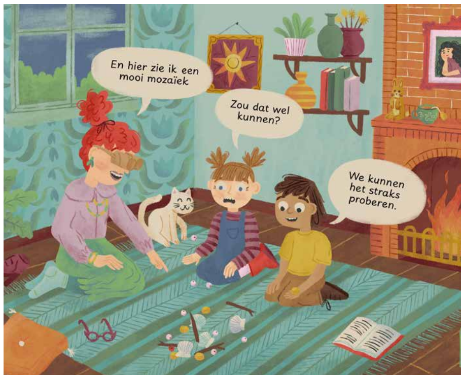
▲ Afbeelding 2. De wonderlijke bril van tante Til.

draaien om de vraag: Kan dit kloppen? De opdrachten gaan onder andere over blokkenbouwsels, doosjes, tellen, en over de vraag wat er wel en niet in de klas past.