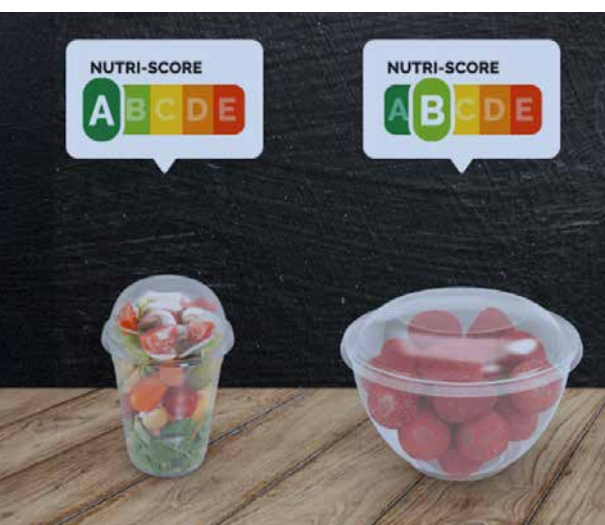
▲ Afbeelding 5. Redeneren over de Nutri-score.

De beschrijving van de Grote Rekendag aan de hand van wiskundige denk- en werkwijzen en wiskunde en de wereld laat zien dat de Grote Rekendag prachtige mogelijkheden biedt om te werken aan de nieuwe kerndoelen. De beschrijvingen hiervoor zijn slechts illustraties van een aantal van de manieren waarop aan de kerndoelen gewerkt wordt, en zijn in die zin niet compleet. De Grote Rekendag is een belangrijke mogelijkheid om rekenen en wiskunde aan de belevingswereld van leerlingen te koppelen, waarbij open problemen verschillende aanpakken uitlokken en interactie tussen leerlingen wordt gestimuleerd.