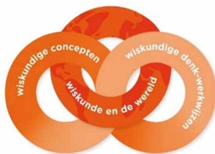
► Afbeelding 1. De drie domeinen van de kerndoelen rekenen en wiskunde.

O p woensdag 18 maart 2026 vindt alweer de 24ste editie van de Grote Rekendag plaats, dit keer met het thema “Kan het kloppen?”. De Grote Rekendag is niet alleen een dag vol ontdekkingen en onderzoek, maar biedt ook een concrete manier om de nieuwe kerndoelen voor rekenen-wiskunde (SLO, 2025) in het onderwijs vorm te geven (zie ook Los, 2023). In dit artikel geven we een overzicht van de activiteiten met daarbij telkens een beschrijving van de relatie met een van de nieuwe kerndoelen (afbeelding 1).